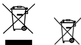
Symbol 1 Symbol 2

Consumers must be informed—by means of the symbols below—that the electrical equipment in question must not be disposed of with household waste. All new electrical devices are marked with such symbols. The symbol may appear directly on the device, on its packaging, or in the user manual or warranty certificate.